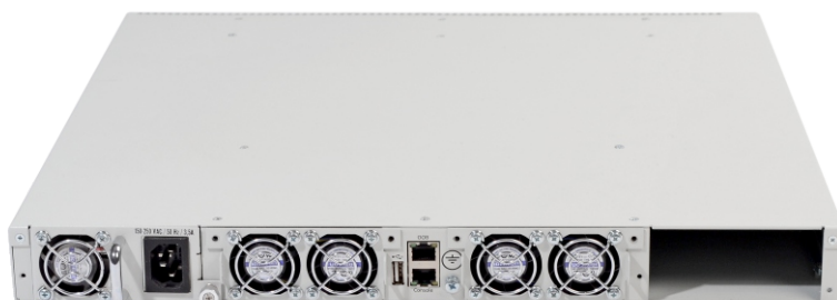
Задняя панель MES7048