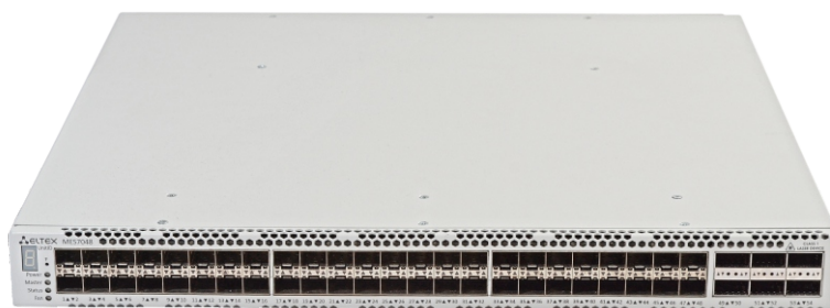
Передняя панель MES7048