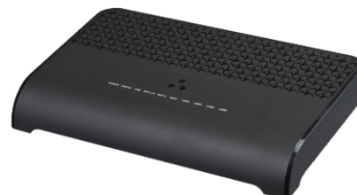
RG-5520G-Wax rev.B/RG-5520G-Wax-Z rev.B

RG-5520G-Wax/Wax-Z — двухдиапазонный Wi-Fi роутер с гигабитными портами LAN Ethernet и 2.5 гигабитным портом WAN Ethernet с мощным двухъядерным процессором. Устройство поддерживает стандарт 802.11ax, который работает одновременно с двумя потоками, обеспечивая скорость до 1.201 Гбит/с на диапазоне 5 ГГц. Использование технологии MU MIMO позволяет сделать устройство универсальным решением для организации корпоративных сетей.