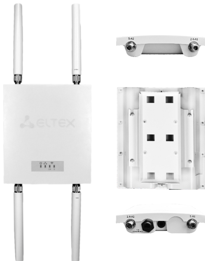
Точка доступа WOP-2ac

Для стабильной и непрерывной работы устройства используются высокопроизводительные процессоры Broadcom, позволяющие добиться самых высоких показателей в скорости обработки данных.